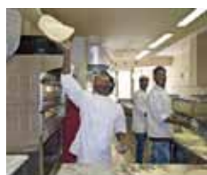
TURNING 18 AND UNDOCUMENTED: SUPPORTING CHILDREN IN THEIR TRANSITION INTO ADULTHOOD